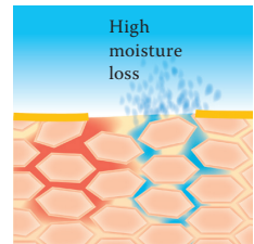
Loss of lipids results in a breakdown in skin barrier function. The skin loses a large amount of water and dries out.